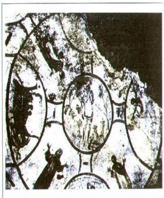
تصویر ۱. نمایی از نقاشی

نشانه در بحث ما نقش بسیار مهمی بازی می‌کند و بدون تعریف مفهوم آن، قادر نخواهیم بود به‌طور شایسته تفاوت واقعی میان زبان هنری و سخن مذهبی را مشخص کنیم. نماد و نشانه، دو مفهومی هستند که به‌زعم بسیاری از صاحب نظران در ساحتی دینی و با رویکردهای مذهبی شکل گرفتند و به تدریج به حوزه‌های غیردینی اشاعه یافتند. به نظر گادامر در عهد باستان، هنر وسیلهٔ بازنمایی حقایق عالم بود و آرام آرام از حقیقت دینی عبور کرد، اما تاریخ مسیحیت ارتباط تنگاتنگی با هنر و آثار هنری دارد و بنابراین شناسایی تاریخ هنر این دین، مسائل بسیاری را در جهان مسیحیت آشکار خواهد کرد.