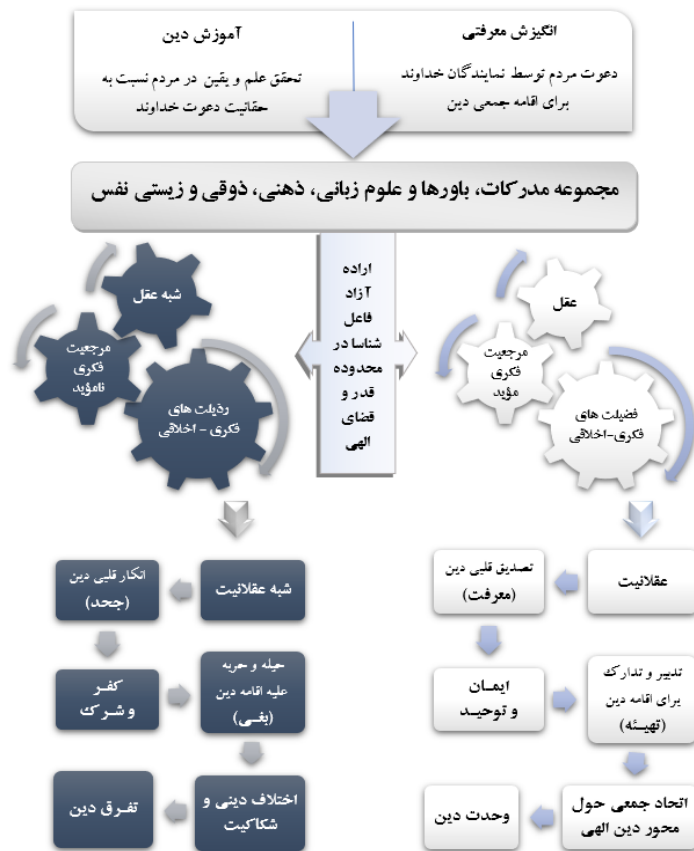
شکل ۳. جایگاه عوامل معرفتی و غیرمعرفتی مؤثر در اختلاف و تفرقه دینی

بدین ترتیب ایجاد انحراف در معیارهای عقلانیت از طریق ۱. «سلب مرجعیت معرفتی از انبیا و اوصیا» و جایگزینی مراجع دروغی و فاقد تأیید، و ۲. «ترویج شبه‌عقل/جهل» به جای عقل، سبب بسط شبه عقلانیت (جاهلیت و شیطنت) به جای عقلانیت، مانع از حصول و ظهور مراتب مشکک باور دینی و معرفت جمعی نسبت به آموزه‌های انبیای الهی و عامل بغی اجتماعی، اختلاف دینی، تفرق دین و انحراف از صراط مستقیم شده است. الگوریتم بعدی تلاشی برای نمایش عوامل مؤثر در این فرایند تاریخی است: