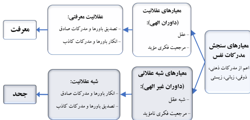
شکل ۲. نسبت معیارهای عقلانی و شبه‌عقلانی با معرفت

طبق مبنای این نگاه، واقعیت غایی خداوند یکتاست و نزد او دو معیار برای داوری مورد تأیید است: یکی برونی و آشکار و دیگری درونی و پنهان؛ و استناد اجتهادی به آنها می‌تواند ضامن عقلانیت و موجب پذیرش علم و حصول معرفت باشد. معیار درونی معرفت انسان، خود «عقل» و معیار بیرونی آن، «سمع» است (مُلک / ۱۰؛ الکلینی، ۱۴۰۷ق، ج ۱: ۱۶). اصطلاح «سمع» که در بیان معرفت‌شناسان معاصر «مرجعیت فکری» خوانده می‌شود، در اینجا عبارت است از: فرایند تأثیرپذیری و کسب علم از طریق استماع کلام و حیانی از انبیا و اولیا، که بی‌نیاز از فرایند تعقل، به تصدیق و ایمان منتهی گردد. اگر دستگاه معرفت‌شناختی بشر مجهز به معیارهای عقلانیت/معرفت تأیید شده (مؤید نزد واقعیت غایی) اعم از درونی و بیرونی باشد که در نفس‌الامر به‌مثابه داوران الهی حاضرند و آنها را ملاک ارزیابی خود در تشخیص صدق از کذب قرار دهد، به «معرفت» مجهز شده و می‌تواند به حقیقت نزدیک شود. اما اگر آغشته به معیارهای شبه‌عقلانی در داوری و تشخیص باشد، حتی اگر متکی به آنها به قطع برسد، مبتلا به «شبه عقلانیت» و دچار جحود می‌گردد. معیارهای شبه عقلانی، شامل شبه‌عقل (جهل ۱ و جنود آن) به‌عنوان عامل درونی و نیز مراجع فکری نامؤید به‌عنوان عامل بیرونی است. نسبت عوامل مذکور در تصویر زیر نشان داده شده است: